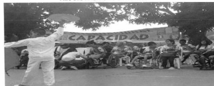
Ilustración: Extracto del informe del contratista contenido en el expediente del Contrato 1305 de 2019